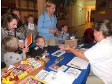
Sorbanállás az ajándékokért