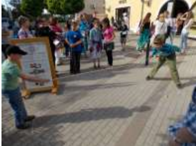
Stratégia és logika