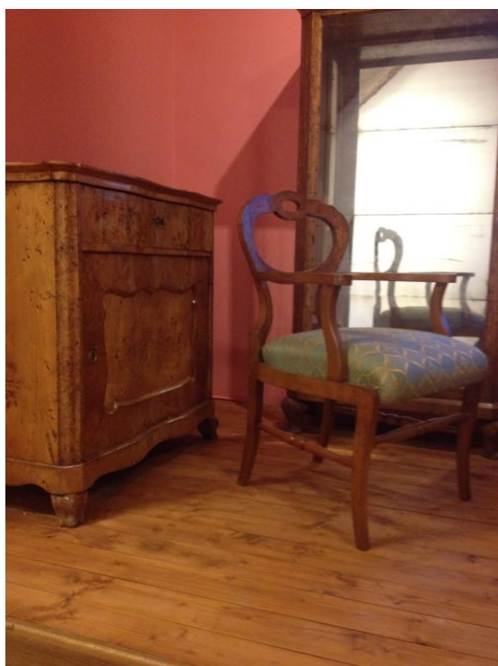
Léda szalongszertartó, 2. terem (restaurált bútorok)