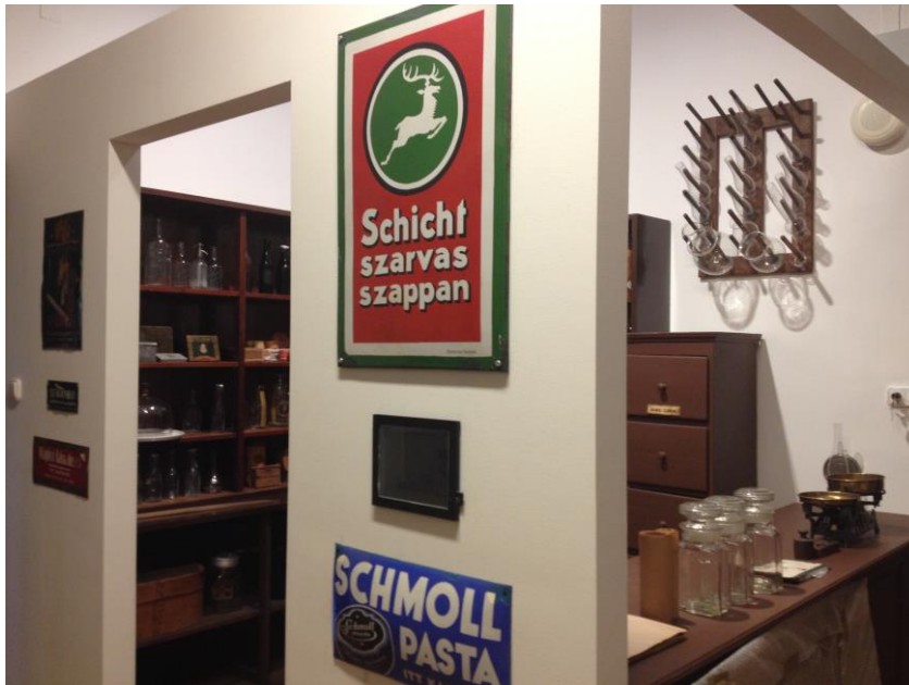
Az átalakított szatócsbolt, 4. terem