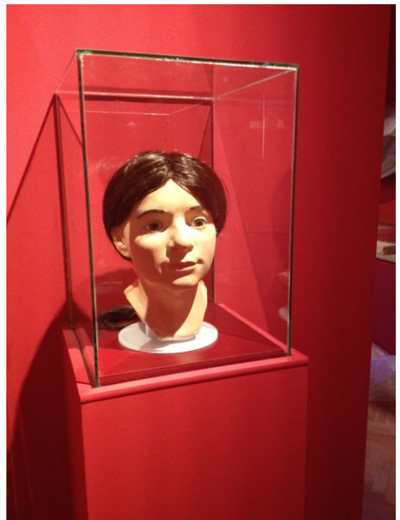
Török kori kislány fejrekonstrukció, 1. terem (Itt a rekonstruált pártá még nem került rá a fejre)