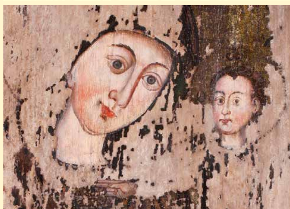
RÉSZLET RESTAURÁLÁS ELŐTT ÉS UTÁN