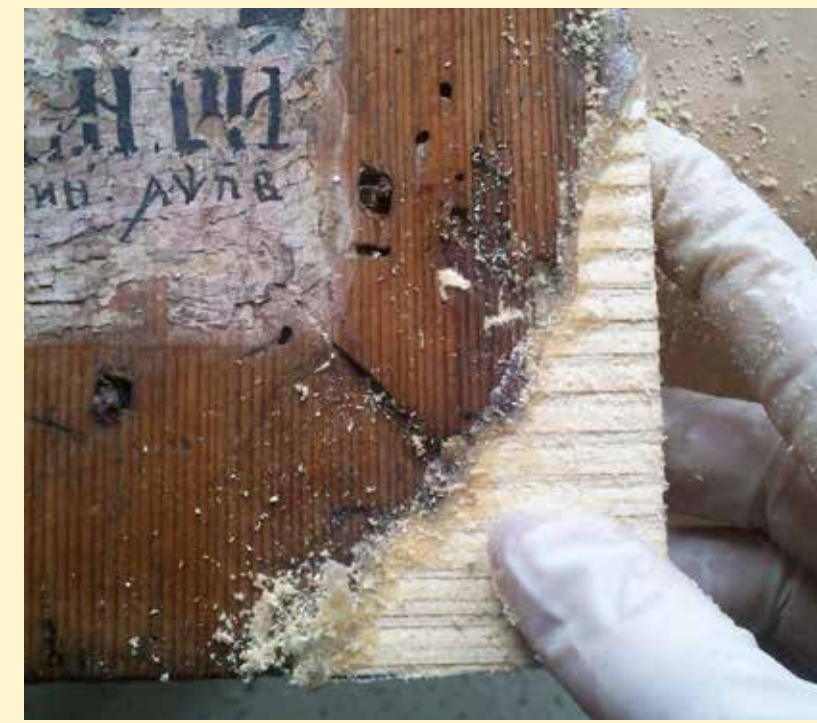
A LECSORBULT SAROK PÓTLÁSA