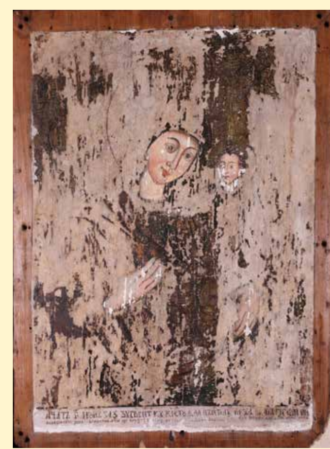
FELTÁRT, TÖMÍTETT ÁLLAPOT