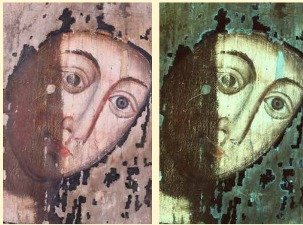
NORMÁL ÉS UV-LUMINESZCENS RÉSZLETFELVÉTELEK A FELTÁRÁSRÓL