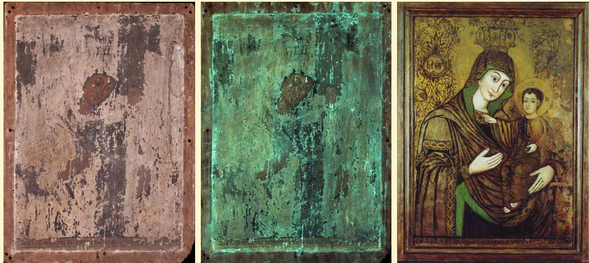
NORMÁL ÉS UV-LUMINESZCENS FELVÉTELEK AZ ÁTVÉTELI ÁLLAPOTRÓL