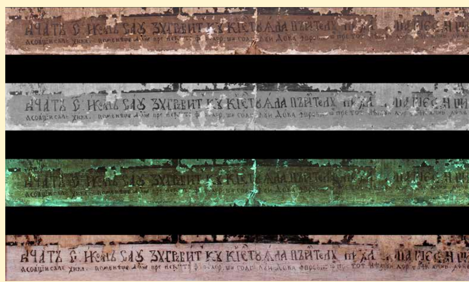
A KÉP ALJÁN VÉGIGHÚZÓDÓ SZÖVEGSÁV (NORMÁL, INFRAVÖRÖS ÉS UV- LUMINESZCENS FELVÉTELEK AZ ÁTVÉTELI ÉS NORMÁL FELVÉTEL A RESTAURÁLT ÁLLAPOTRÓL)